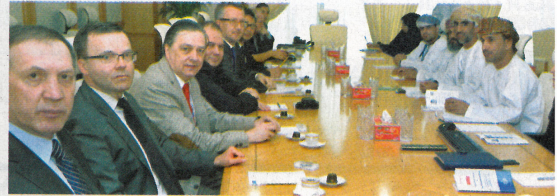
... الوفد التجاري البولندي خلال لقائه بمسؤولي الهيئة العامة لترويج الاستثمار وتنمية الصادرات