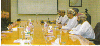
... ومع مسؤولي واحة المعرفة مسقط.