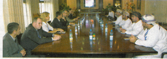
... وخلال لقائه بمسؤولي منطقة الرسيل الصناعية